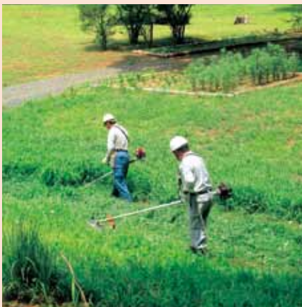
[小幡北山埴輪公園草刈作業]