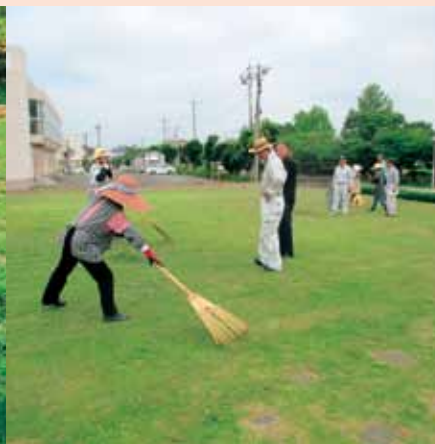
[役場庁舎敷地集積作業]